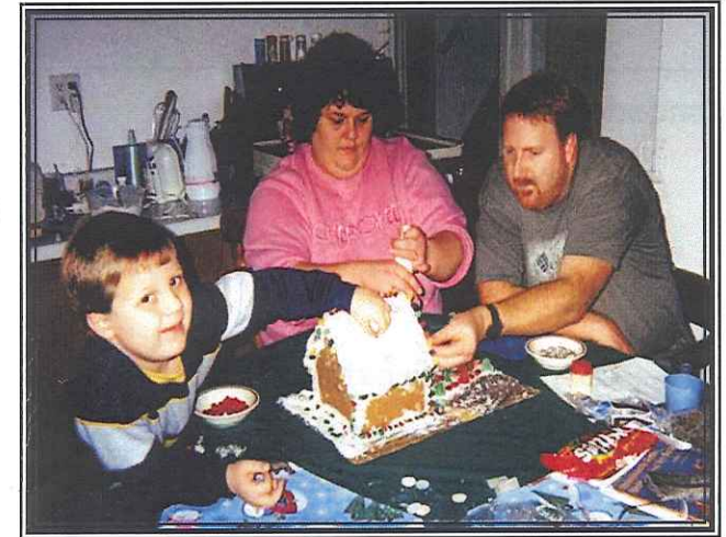
Head Start coopera con los padres en su papel de ser las personas principales que toman decisiones para sus hijos.